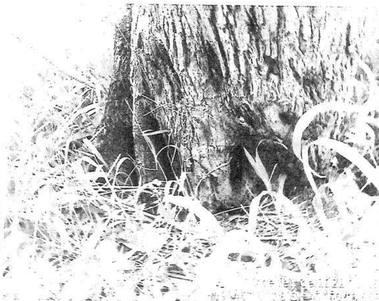
Alfeneiro ( Ligustrum lucidum ) a ser suprimido.