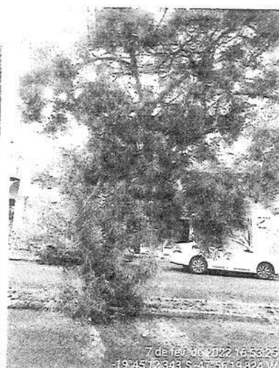
Os três chapéus-de-napoleão ( Thevetia peruviana ) a serem suprimidos

Considerando que os espécimes a serem suprimidos estão no entorno de bem inventariado pelo Conselho de Patrimônio Histórico e Artístico de Uberaba (Conphau), encaminhamos o presente Relatório Técnico para apreciação e deliberação do referido órgão.