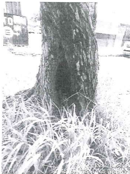
Alfeneiro ( Ligustrum lucidum ) a ser suprimido.